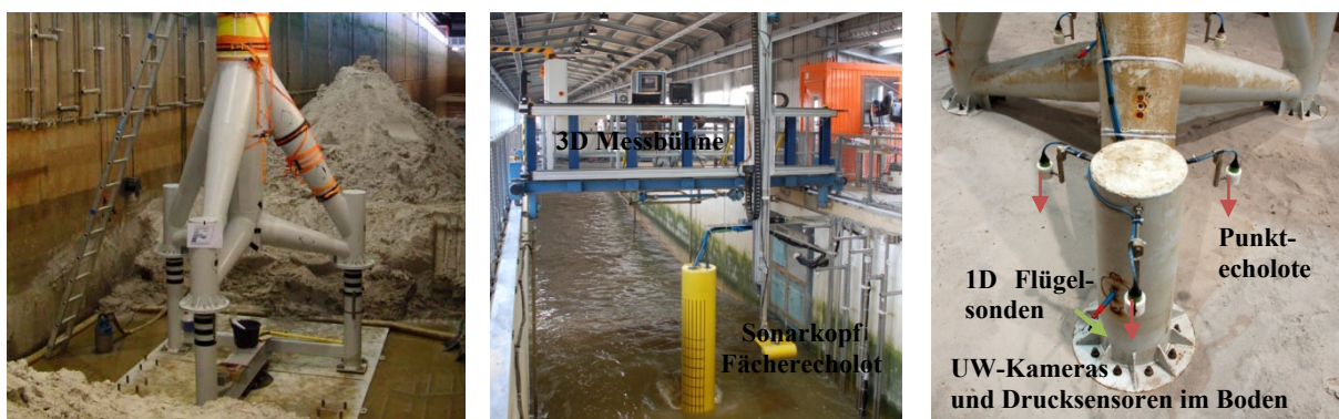
Abbildung 1: Tripod-Modell im Maßstab 1:12 im GWK mit Unterkonstruktion (links), Messbühne und Fächerecholot (Mitte), Teil der Mess-Sensorik (rechts)

Zur vertieften Analyse der Kolkphänomene um die Tripod-Struktur unter minimierten Laboreffekten, insbesondere im Bezug auf die Skalierungsproblematik des Modellsedimentes, wurden in 2010 großskalige physikalische Modellversuche im Maßstab 1:12 im Großen Wellenkanal (GWK) des Forschungszentrums Küste in Hannover durchgeführt. Hierzu wurde eine bewegliche Sohle (ebenfalls Feinsand, d_{50}=0,15 mm) in einer Schichtdicke von 1,2 m und einer horizontalen Fläche von 175 m 2 in den Kanal in Kombination mit entsprechenden Anrampungen vor und hinter dem Untersuchungsgebiet (Neigungen 1:20 und 1:15) eingebaut (Abbildung 1). Das Tripod-Modell (mit ähnlichen Strukturabmessungen wie der Prototyp) wurde dabei in der Mitte des horizontalen Untersuchungsgebietes der beweglichen Sohle bei einer Fixierung an der Kanalsohle eingebunden. Zur Untersuchung zweier Anströmrichtungen der drei Standbeine bzw. Gründungspfähle des Tripods im Bezug auf die Haupt-Wellenangriffsrichtung (0°: ein Bein, 60°: zwei Beine zur Wellenangriffsrichtung) konnte das Modell in zwei Positionen um die vertikale Achse gedreht eingebaut werden.